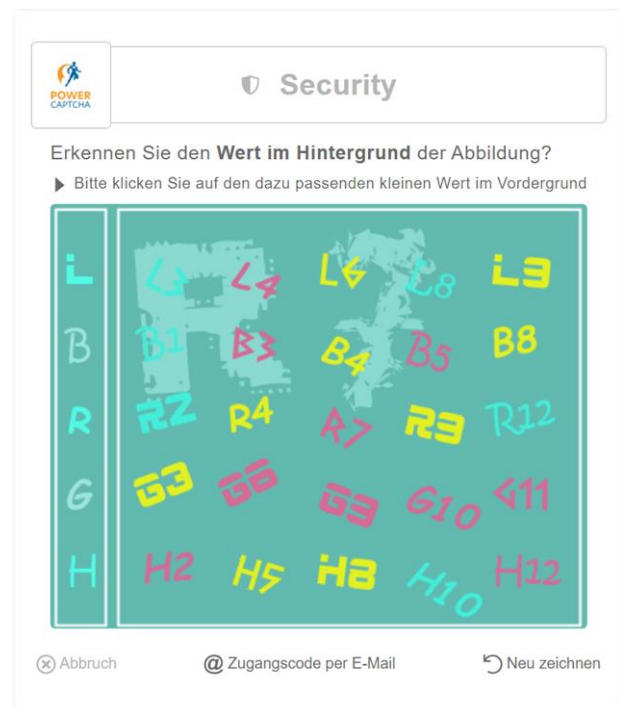
Abbildung 1: Sicherheitsabfrage mit POWER CAPTCHA

Im Gegensatz zu anderen Captchas, unterscheidet POWER CAPTCHA nicht nur, ob ein Mensch oder ein Bot eine Interaktion ausgelöst hat, sondern prüft grundsätzlich, ob der Zugriff berechtigt ist oder nicht. Jede Interaktion mit POWER CAPTCHA erzeugt einen verschlüsselten Code, den die zentrale POWER CAPTCHA-KI bewertet und sich für eine begrenzte Zeit merkt, um anschließend bei weiteren Interaktionen den Schwierigkeitsgrad der Lösung zu erhöhen, die Antwortzeit zu verlängern oder ggf. weitere Interaktionen für eine gewisse Zeit abzulehnen.